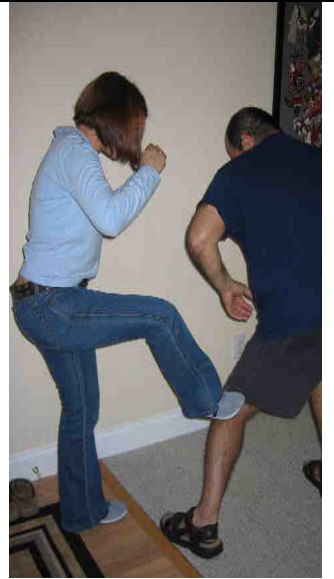
Ella ataca la rodilla del asaltante y sale corriendo del área gritando y pidiendo auxilio lo mas alto posible