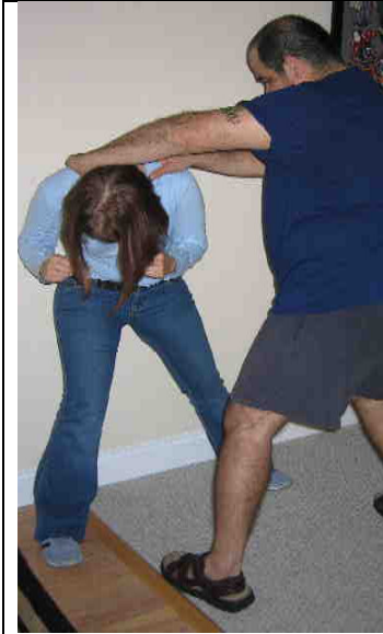
La victima mueve la cabeza hacia abajo y fuera del agarre y mueve su cuerpo en la misma dirección