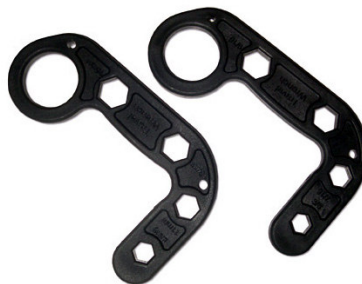
Travel Wrench Key Ring

Armas no-mortales o armas blancas irritantes: como mace y pimiento o armas especialmente diseñadas para propósitos de defensa por ejemplo el llavero del viajero—Travel Wrench Key Ring —son altamente recomendados. El llavero del viajero fue inventado por “Mr. Kelly S. Worden.” Este fue inspirado por el cuchillo de pelea “Barrio Knife” utilizado en las artes marciales de las islas Filipinas e Indonesia. Pero la llave se puede llevar a lugares donde los cuchillos son restringidos y su efecto es tan destructivo como el del cuchillo.