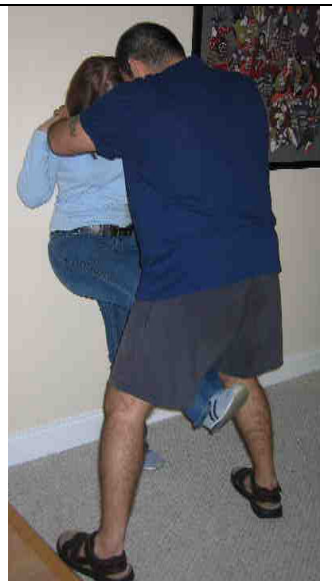
La victima agarra las muñecas, aplica presión hacia abajo y pateo al atacante entre las piernas