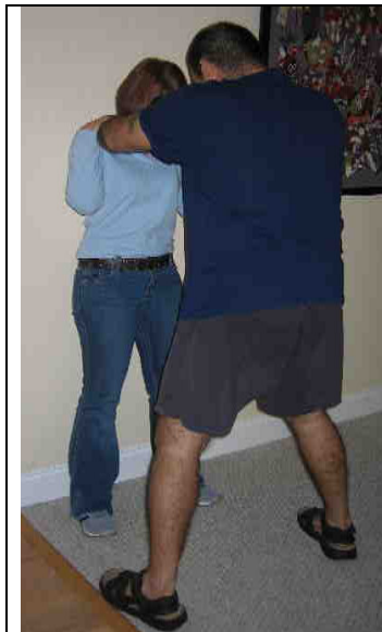
El atacante agarra la victima por el cuello.