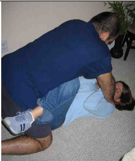
El asaltante tira la victima al suelo y la trata de estrangular